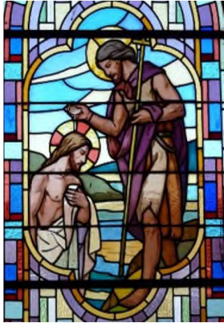
Vitrail – Église Saint-Martin, Varennes-sur-Loire, France